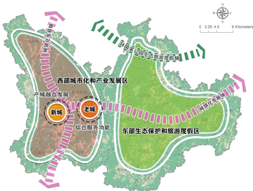
图 2-1 “一县双城，双区共进” 县域总体发展格局